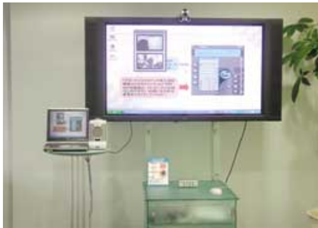
写真1 遠隔簡易コンサルティング

また、セミナールームでは、最大60席のスペースを確保し、最新機器を備え、お客様のニーズに合わせて、様々なセミナーやプレゼンテーションを開催している。特別展示ルームでは、ご来場のお客様に合わせて特別展示や、ブロードバンドオフ