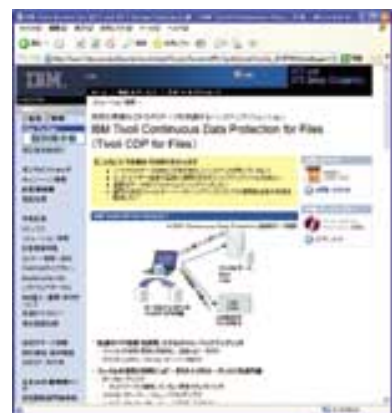
画面3 ソリューション情報画面

また、専用サイトでは、こうしたShoppingの機能だけではなく、ミドルウェアとしてのIBMソフトウェア製品の魅力をわかりやすくNTTグループへ紹介するために、課題解決型のソリューション形式での製品紹介や特集記事などの読み物形式での紹介などに取り組んでいる。多岐にわたるこうした内容を閲覧し、詳細が知りたいなどの要望があった場合、