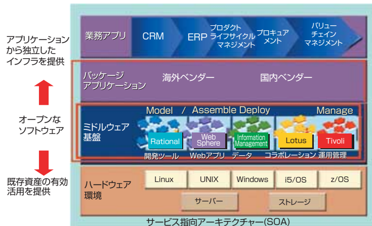
図1 IT業界におけるIBMソフトウェアの位置づけ