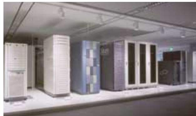
写真1 SWCOCのマシン・ルーム(異機種混在環境)