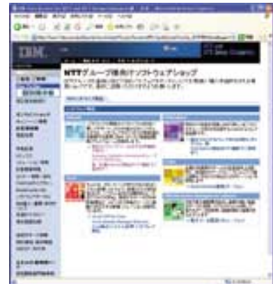
画面2 ソフトウェアショップ画面

も同様のWebを開設しているが、IBMでは総合メーカーである強みを活かして、x86サーバーだけでなく提供可能な製品ラインナップの充実を図っている。