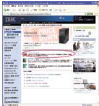
画面1 専用サイト トップ画面

8月号でも紹介したが、IBMではNTTグループへの対応強化・スピードアップを行うために専用Webサイトを開設し、eメールマガジンなどによる情報提供やWeb販売に積極的に取り組んでいる。他社