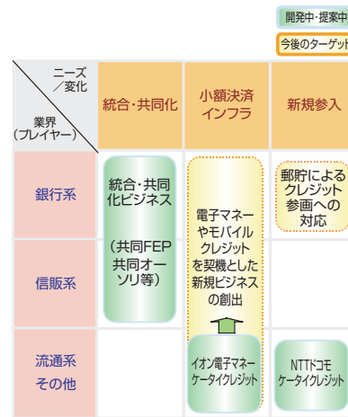
図1 クレジット分野におけるビジネス状況