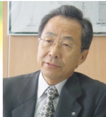
（株）NTTファシリティーズ 代表取締役社長