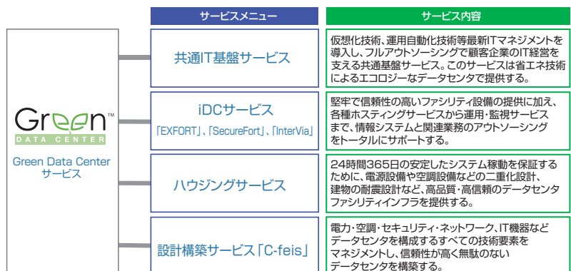
図1 「グリーンデータセンタ」のサービスメニュー

—そういった3つのトレンドを踏まえ、本年1月より「グリーンデータセンタ」サービスを提供されましたが、コンセプト及びサービスの全体像を