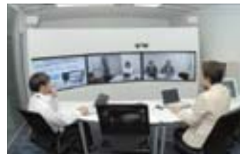
品川・関西の会議や教育に活用している UNIVERGE UC会議実験システム

現在では、企業を取り巻く課題に対応するソリューションを、「ビジネススタイル改革」「ワークスタイル改革」「マネジメントスタイル改革」の3つテーマで展示し、お客様とともに考えることにより、お客様企業のイノベーションを支援している。