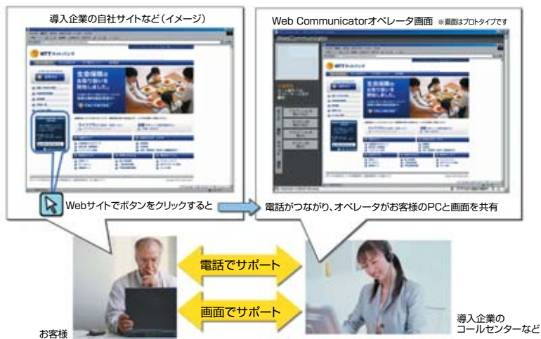
図3 Web Communicatorの導入イメージ

NTTコミュニケーションズでは、新しいワークスタイル、コミュニケーション強化の実現に向け、B2BからB2Cまでサービスの拡充を進めていく。