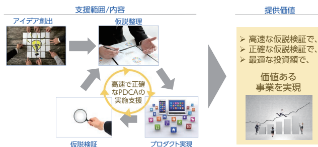
図2 リーンスタートアップ支援サービス

「リーンスタートアップ支援サービス」とは、アイデア創出から事業化までの工程を共創/支援