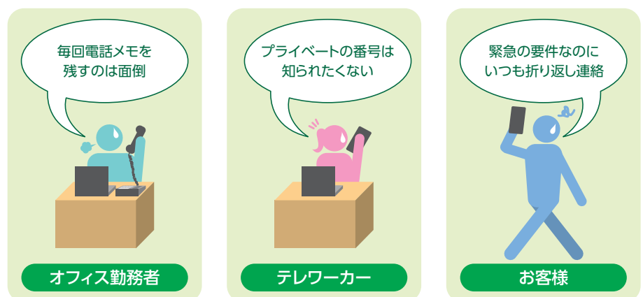
図1 テレワークにおける課題のイメージ

「クラウド型PBXはオンプレミス型PBXと比較して音質が悪いのでは?」と懸念されるお客様もいらっしゃいますが、SmartCloud Phoneは、音声信号の通信を最短距離