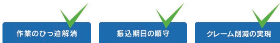
図2 「振込データ一括口座確認機能」利用後のイメージ