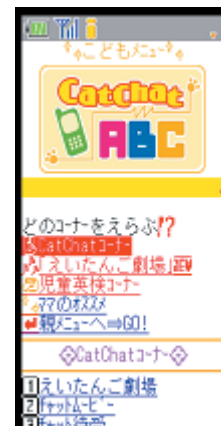
図2 CatChat ABCの 携帯公式サイト

今後NTTLSでは、パーソナライズを実現する端末として、携帯電話を活用したサービスを展開していく。