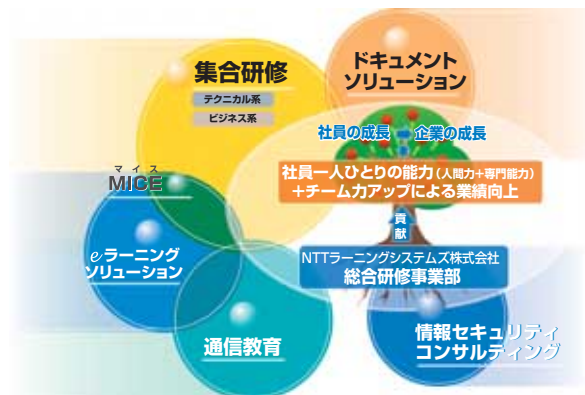
図1 総合研修事業部のソリューションイメージ

NTTLSでは、業務プロセスの改善などのコンサルティングや業務マニュアル制作も積極的に展開している。「業務フローのあるべき姿」を業務改善の視点からアプローチし、企業内の業務ノウハウを蓄積させ、高品質・高付加価値を生み出せる仕組みづくり、研修カリキュラムまでを一括して提案する事業モデルを展開している。