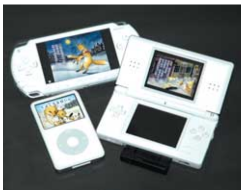
図1 携帯端末に絵本を収納 持ち運び自由な本棚を実現

ネット配信されるコンテンツは、動画(映像+音声)6作品、音声(ポッドキャスト)20作品。第1回配信『てぶくろを買いに』(新美南吉作)は、青空文庫の名作童話にイラストレータによる表現豊かな絵と声優による情感溢れるナレーションを付加した絵本コンテンツからスタート。続いて、「注文の多い料理店」(宮沢賢治作)や「ごん