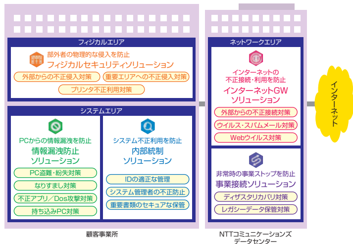
図1 One-Stop Security Solutionの全体像

ICTのプロとして培ってきた豊富なスキル・ノウハウをベースに、組み合わせ自在で、動作検証済みの5つのソリューションにより、あらゆる