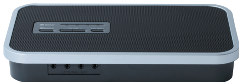
持ち運びに便利な小型・軽量、A5サイズの「R-Talk 800EX」

「R-Talk」シリーズは、国内はもちろん海外で多数の販売実績を誇る「RealTalk C7」の後継ブランドだ。NTTサイバースペース研究所が開発した最新のエコーキャンセラ技術やノイズリダクション技術を用いることで、高品質な音声はそのままに、A5判サイズのスリムボディへの小