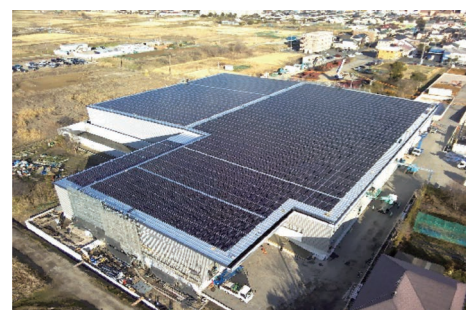
図2 植物工場の屋根置き型メガソーラー 菱電商事株式会社様 （ブロックファーム合同会社様）2022年2月竣工