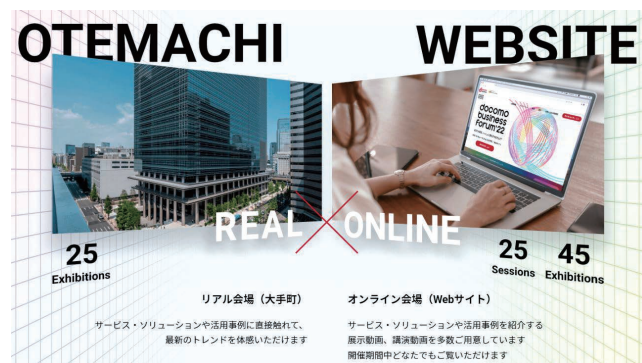
図2 ハイブリット会場イメージ