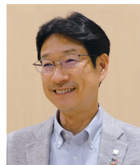
エクシオグループ株式会社 常務執行役員 ソリューション事業本部

2025年までの中期戦略を策定し、打ち出した戦略の1つが、お客様との共創戦略だ。社内の様々な業務改善施策への支援を通じてノウハウを蓄積し、お客様のDX実現に貢献すると共に、各事業本部のコンサル候補に対し、ナレッジやツールを提供し育成を支援するなど、会社全体の提案力、スキルの底上げにも取り組んでいる。当初11人からスタートした本部のメンバは今では70名を超え、技術テーマごとにプロジェクトを分け、それぞれの専門スキルを高めながら案件を通して成長を続けてきた。また、グループ各社へもエコシステムを広げ、グループ連携