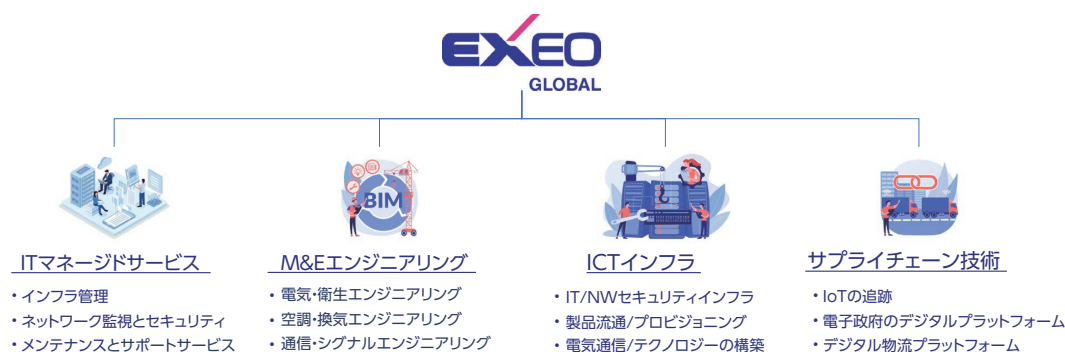
図1 EXEO Global 社の事業領域

Winner Engineering 社は、空調設備工事において Level6 を保有し、空調設備に特化したエンジニアリング企業であり、新築の設計施工から増改築工事まで幅広いプロジェクトに対応し、空調や換気システムの設