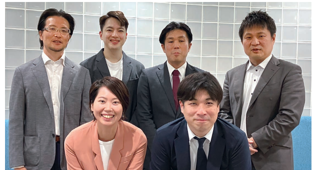
NTT コムウェア株式会社 エンタープライズソリューション事業本部 データマネジメントソリューション部